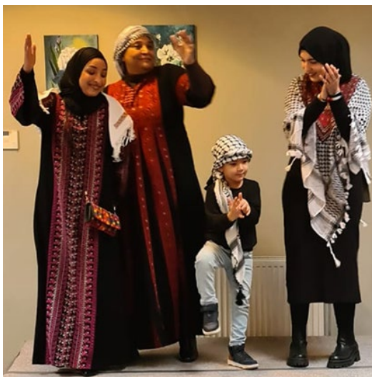
Klederdracht uit Palestina