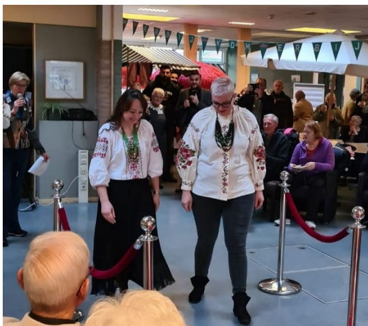
Klederdracht uit Oekraïne