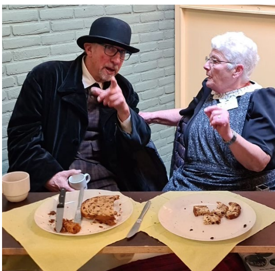
Klederdracht uit de streek