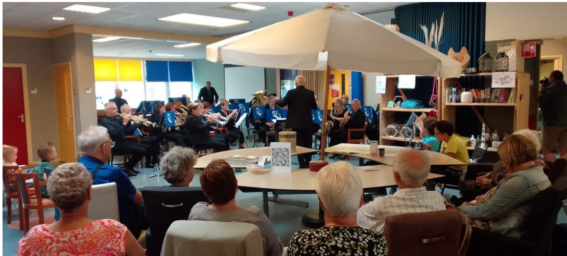
Limburg Stirum Korpsen

Op 1 juli opende De Huiskamer haar deuren voor Limburg Stirum Korpsen, die een muzikale bijeenkomst verzorgde. Gelukkig had de Huiskamer ruimte genoeg, want in totaal was zo'n 70 man, inclusief korps, aanwezig.